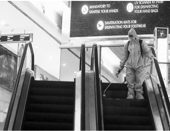
Retail experts say operating costs for mall operators could shoot up by 5-7 per cent this financial year as expenditure to maintain hygiene standards increases

Apart from food courts, multiplexes, and restaurants,